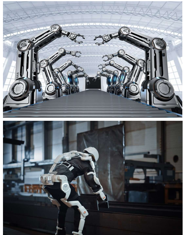
Figure 1. Les roulements sur rouleaux croisés conviennent parfaitement aux articulations de divers types de robots, tels que les robots industriels dotés de bras articulés ou d'un exosquelette bionique.